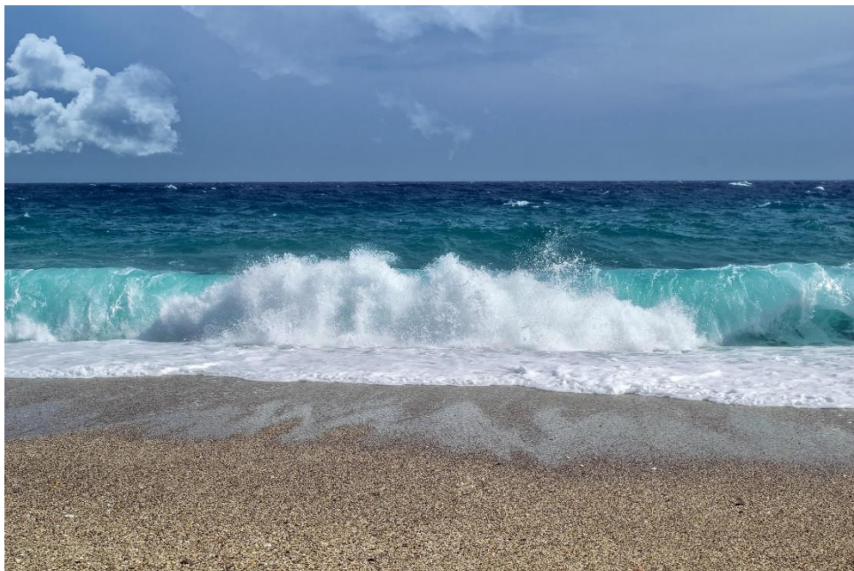
Bild: Strand mit Welle. Bei diesen Temperaturen wäre doch kühlendes Wasser zum Reinspringen genau richtig! Einen schönen Sommer wünscht